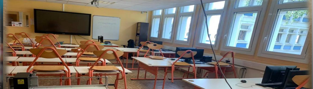
Salle de technologies / Musique / Informatiques