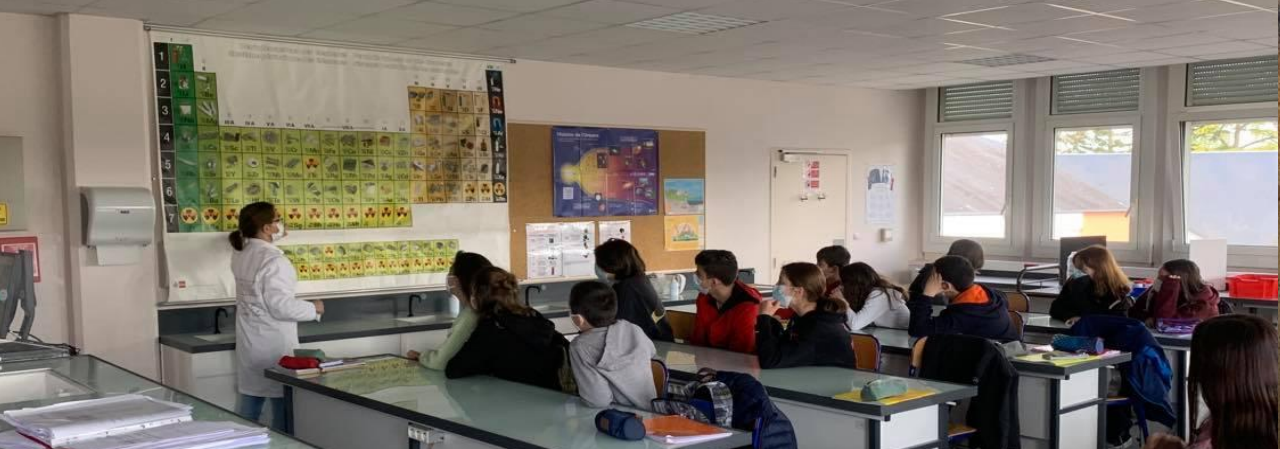
Salle de Sciences / Art Plastiques / Atelier