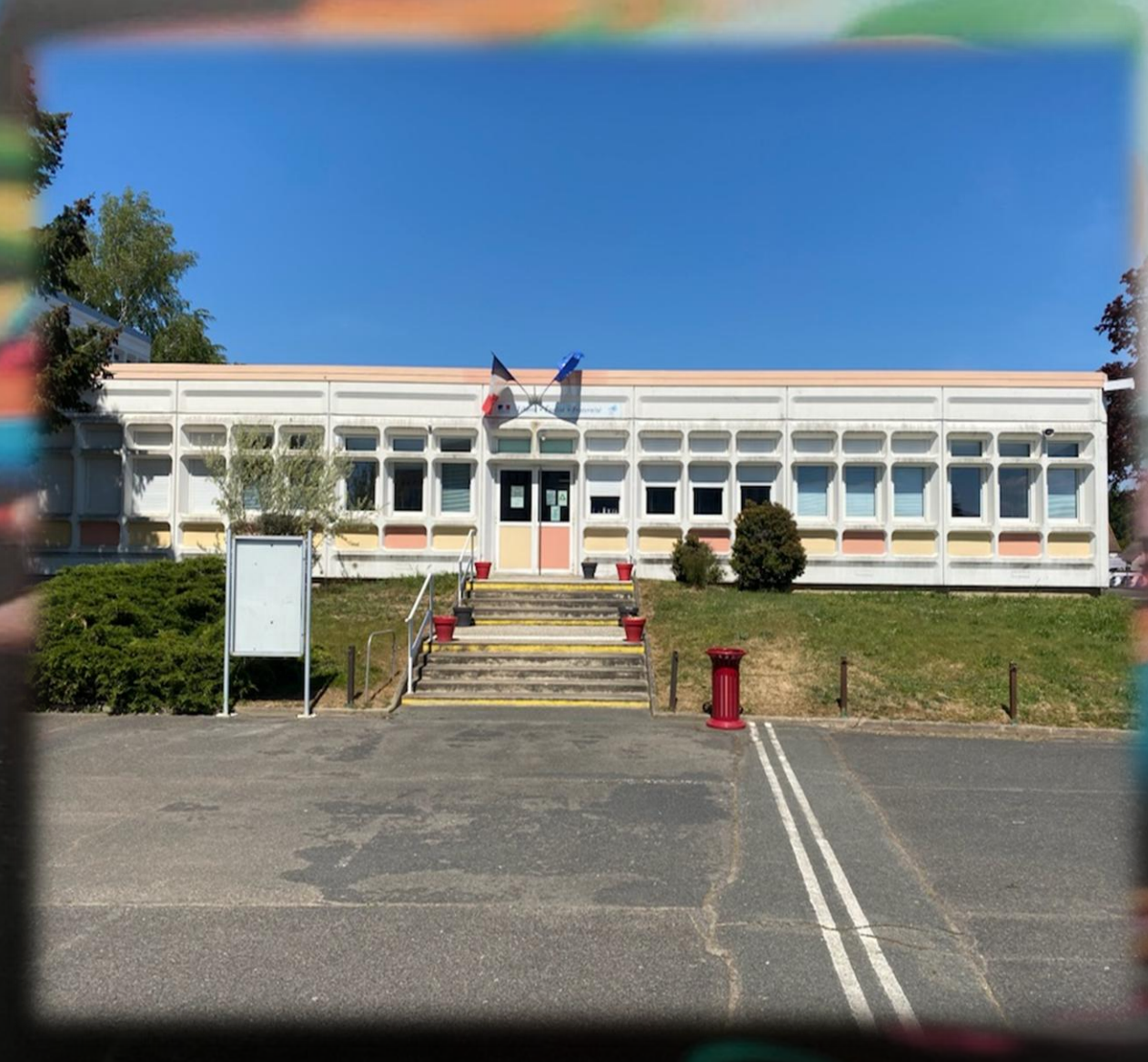
Bâtiment Administratif « orange »