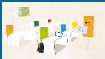
L'École expliquée aux parents

www.onisep.fr/parents , l'espace du site Onisep dédié aux parents, propose :